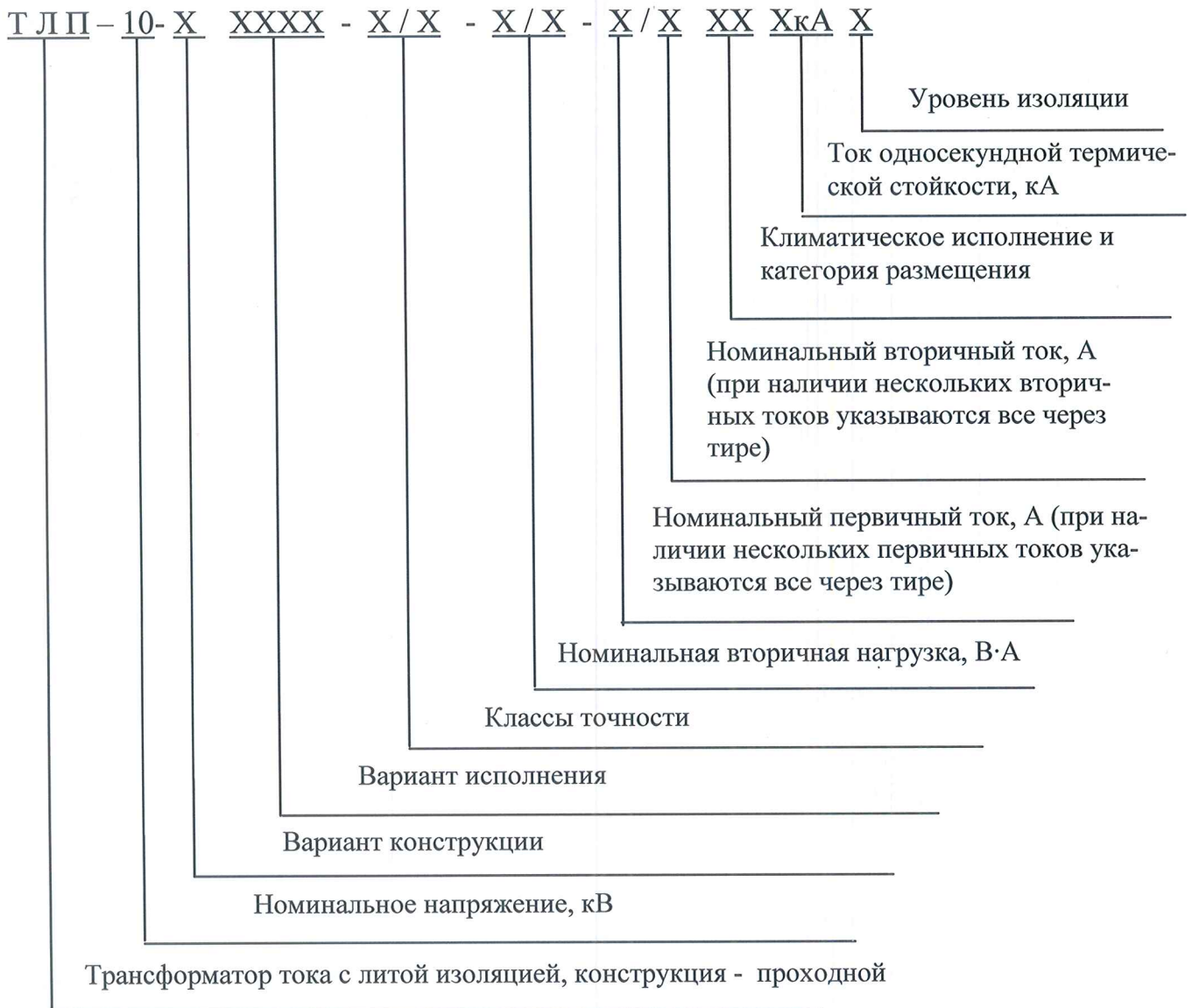
Рисунок 3 – Расшифровка условного обозначения трансформаторов